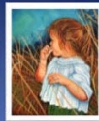
La jeune Réveuse huile 24 x 20