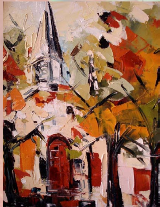
Église du village de Kamouraska Huile sur toile, 14" x 18"