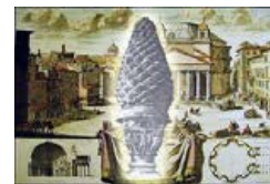
GALLERIA LA PIGNA