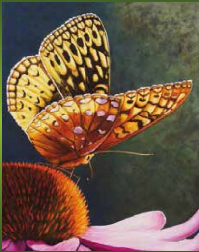
Joyau de la nature

VERNISSAGE le jeudi 18 janvier 2018 de 18h00 à 20h30