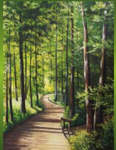
Trottoir de bois