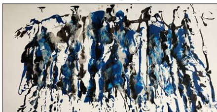
Wild Horses - acrylique sur toile / acrylic on canvas, size 48" x 24"