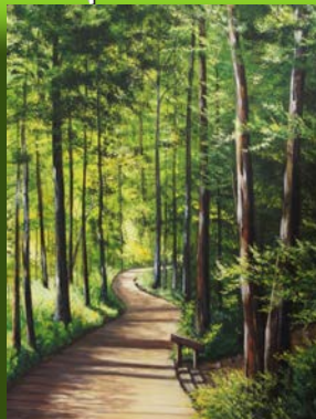
Trottoir de bois