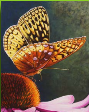
Joyau de la nature