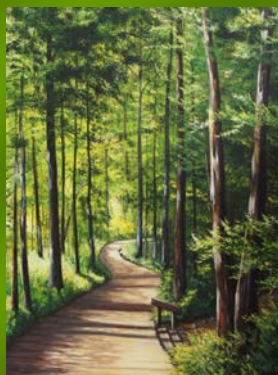
Trottoir de bois