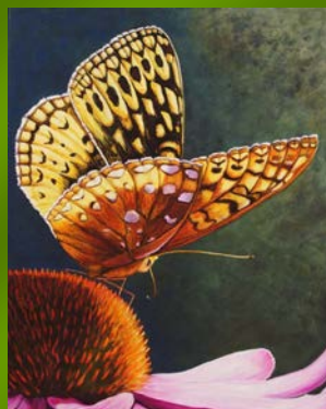
Joyau de la nature