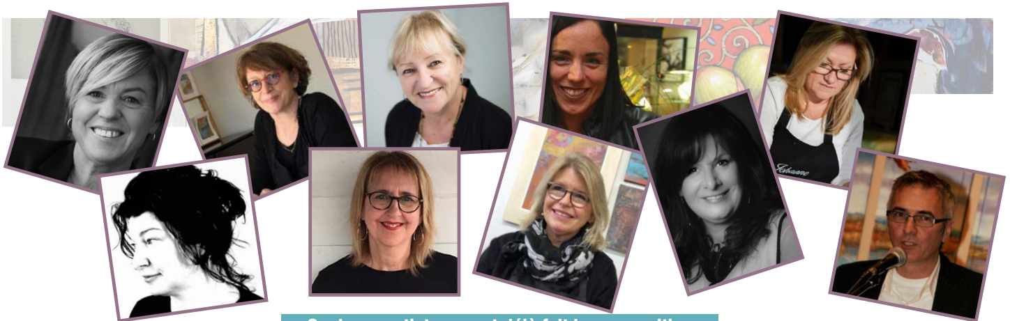
Quelques artistes ayant déjà fait leur apparition sur notre plateforme Zoom

Une rémunération intéressante est offerte à tous nos formateurs et conférenciers.